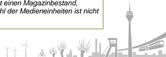
Abb. 1 Screenshot der Online-Erfassung - Magazinbestand